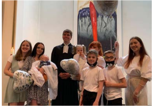
Taufe in der Gnadenkirche