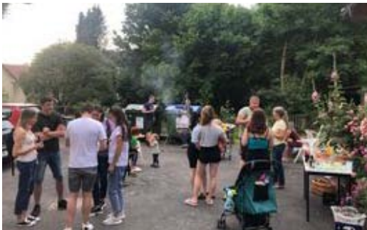
Grillabend im Juni

Doch all dies wäre ohne die ganzen vielen Beine nicht möglich gewesen. Wir sind allen sehr dankbar über die große Unterstützung! Ohne die vielen helfenden Hände und die ausdauernden Beine hätten wir diese gemeinsame Arbeit nicht geschafft. Sei es bei den vielen SpenderInnen, unserer Gemeinde, welche sich durch die unterschiedlichsten Möglichkeiten mit eingebracht hat.